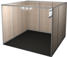
Stand sans angle